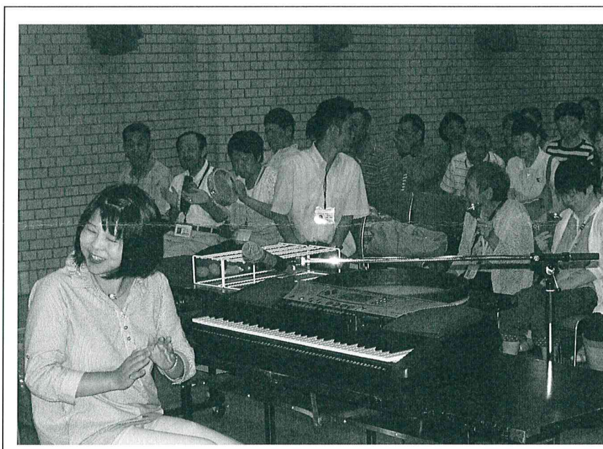
※ 音楽療法士と歌や楽器演奏を楽しむ