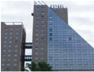
エストレル会議場

ドイツ語と他国語の二つのグループに分かれる。 プログラムは午後も同じ情報提供を行う（午前、午後）