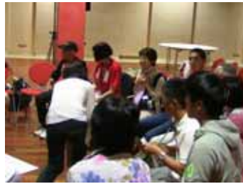
わかりやすい会議グループディスカッション