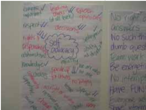
Self Adobocacy について参加者の意見を表に

たまには太陽の子・手をつなぐ、たまにはつなぐちゃんベクトル、たまにブログたまにはチェック